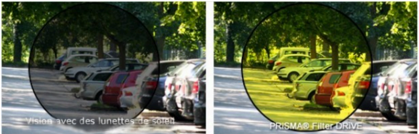
Vision avec des lunettes de soleil classiques