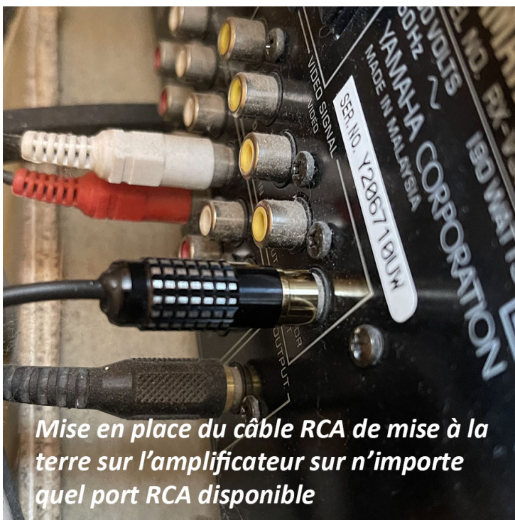
Mise en place du câble RCA de mise à la terre sur l'amplificateur sur n'importe quel port RCA disponible