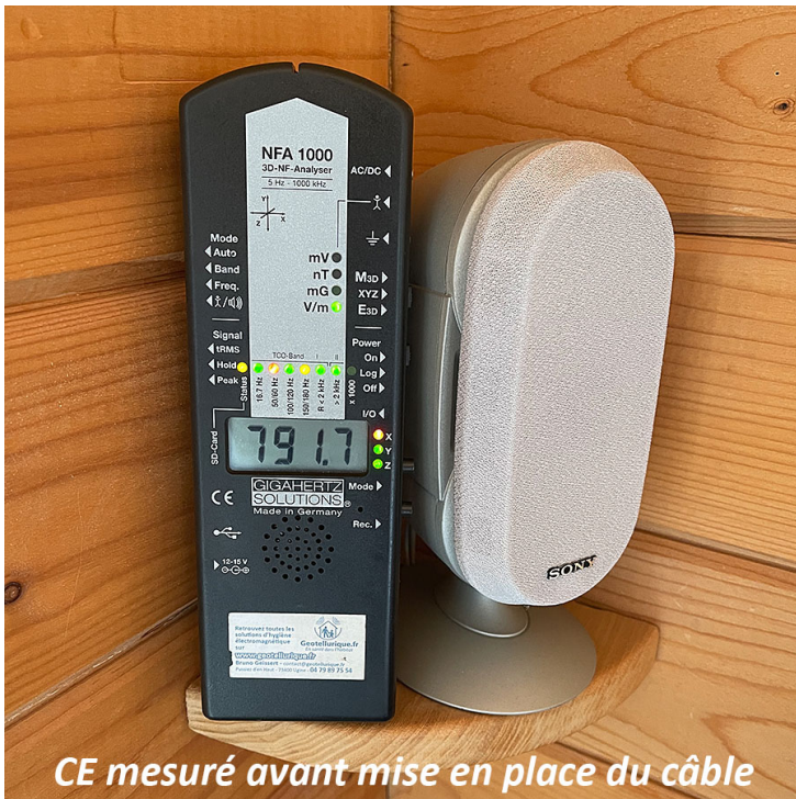
CE mesuré avant mise en place du câble