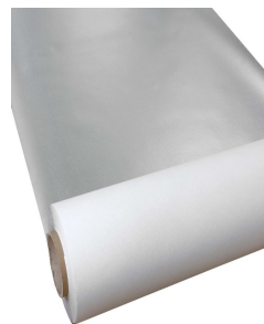
YSHIELD® SAFEBUILD® K150