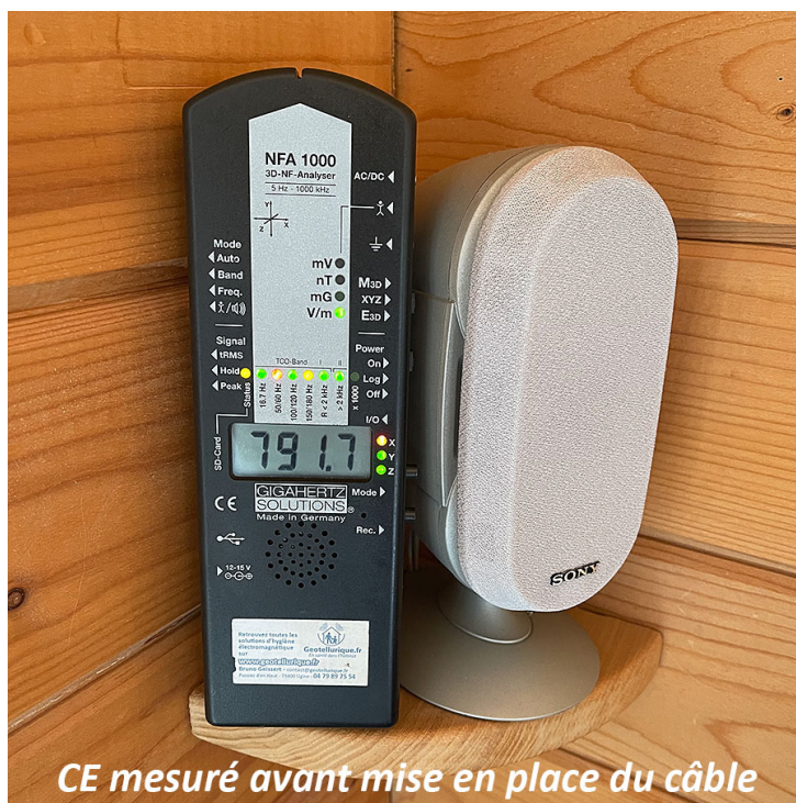
CE mesuré avant mise en place du câble