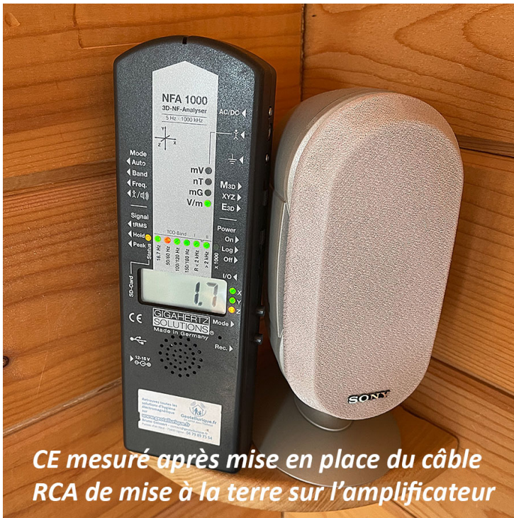
CE mesuré après mise en place du câble RCA de mise à la terre sur l'amplificateur

L'installation est simple : une extrémité est équipée d'une fiche RCA, tandis que l'autre extrémité se connecte à la borne mâle d'une prise murale ou d'une multiprise, y compris les modèles Schuko (voir photos).