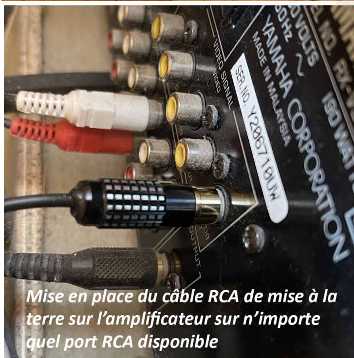
Mise en place du câble RCA de mise à la terre sur l'amplificateur sur n'importe quel port RCA disponible