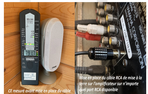
CE mesuré avant mise en place du câble